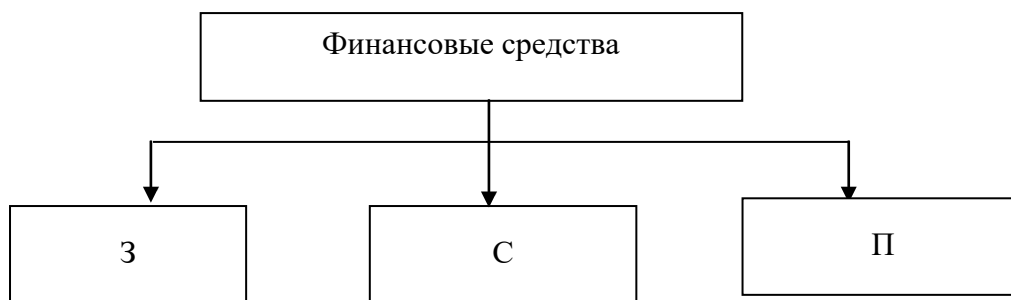
Рисунок 3.1 – Виды финансовых средств: З – заемные; С – собственные; П – привлеченные