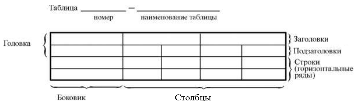
Рисунок 3.2 – Пример оформления таблицы

Пример оформления таблицы приведен на рисунке 3.2.