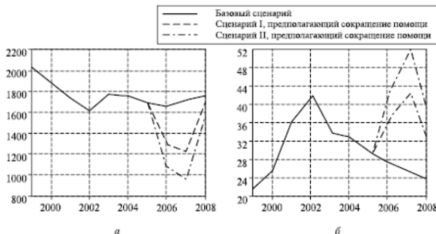
Рис. 1. Последствия сокращения помощи:

а – ВНРД на душу населения, долл. по курсу 1997 г.; б – уровень безработицы, %