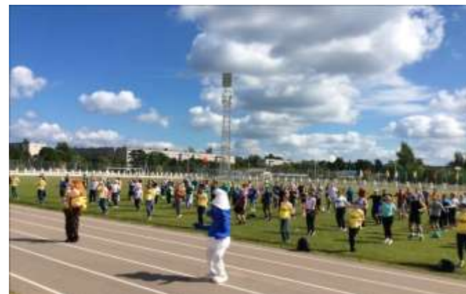
Стадион и футбольное поле