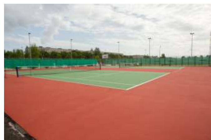
Открытые теннисные корты