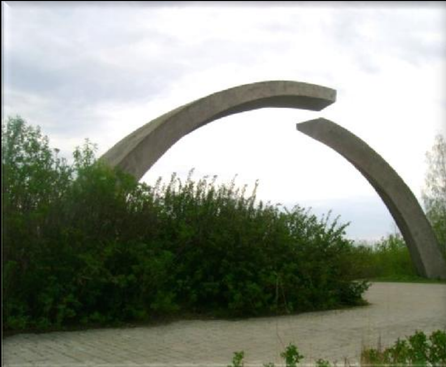
Памятник в честь разрыва блокады Ленинграда