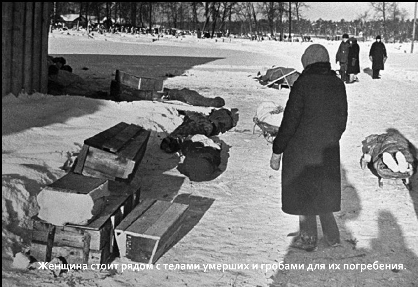
Женщина стоит рядом с телами умерших и гробами для их погребения.