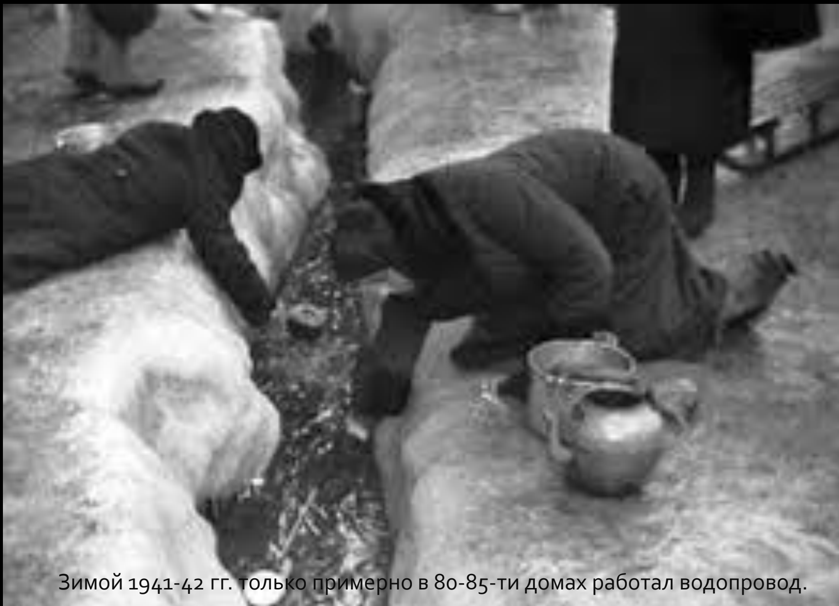
Зимой 1941-42 гг. только примерно в 80-85-ти домах работал водопровод.