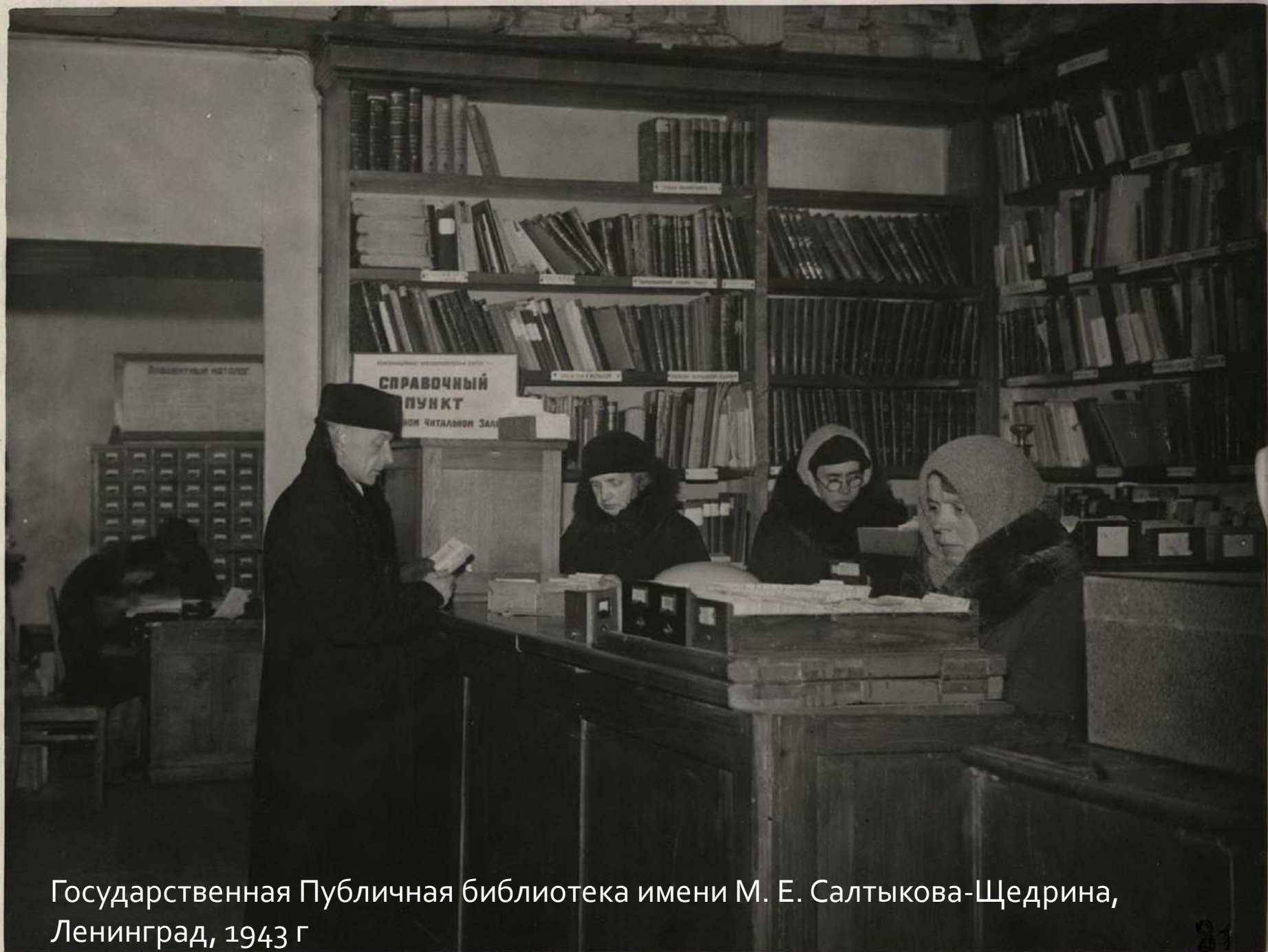
Государственная Публичная библиотека имени М. Е. Салтыкова-Щедрина, Ленинград, 1943 г