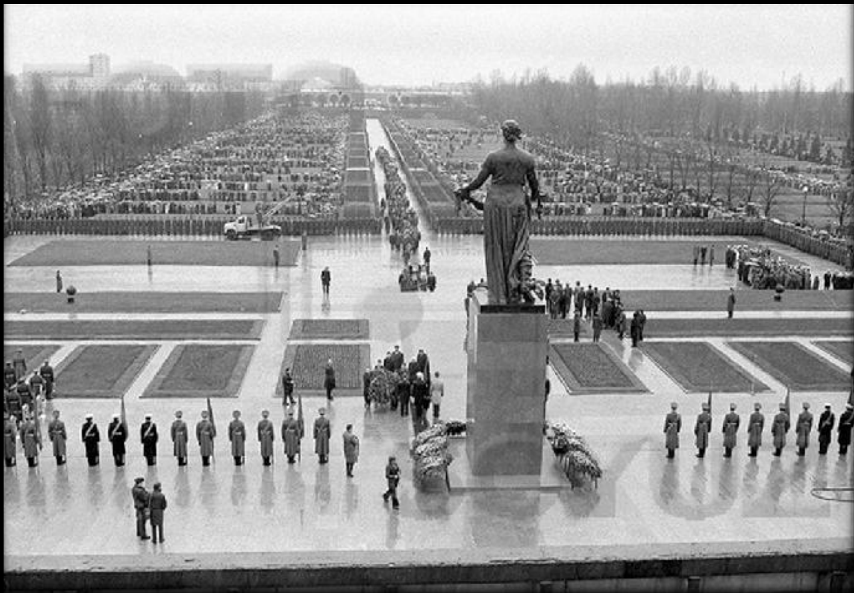
Пискаревское мемориальное кладбище