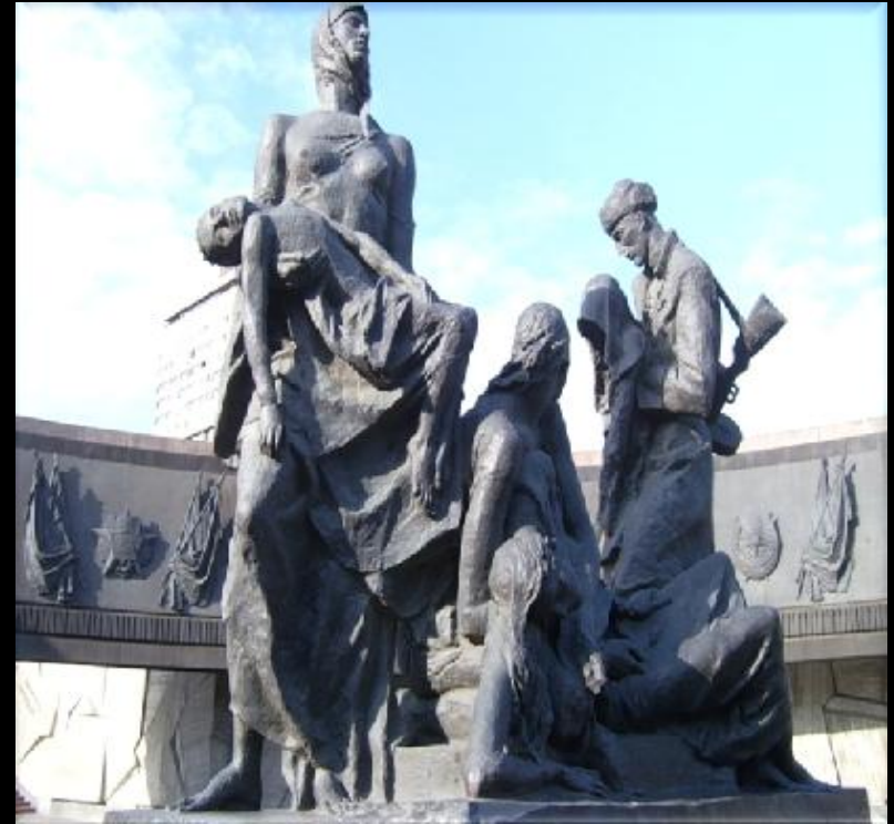
Памятник героическим защитникам блокадного Ленинграда