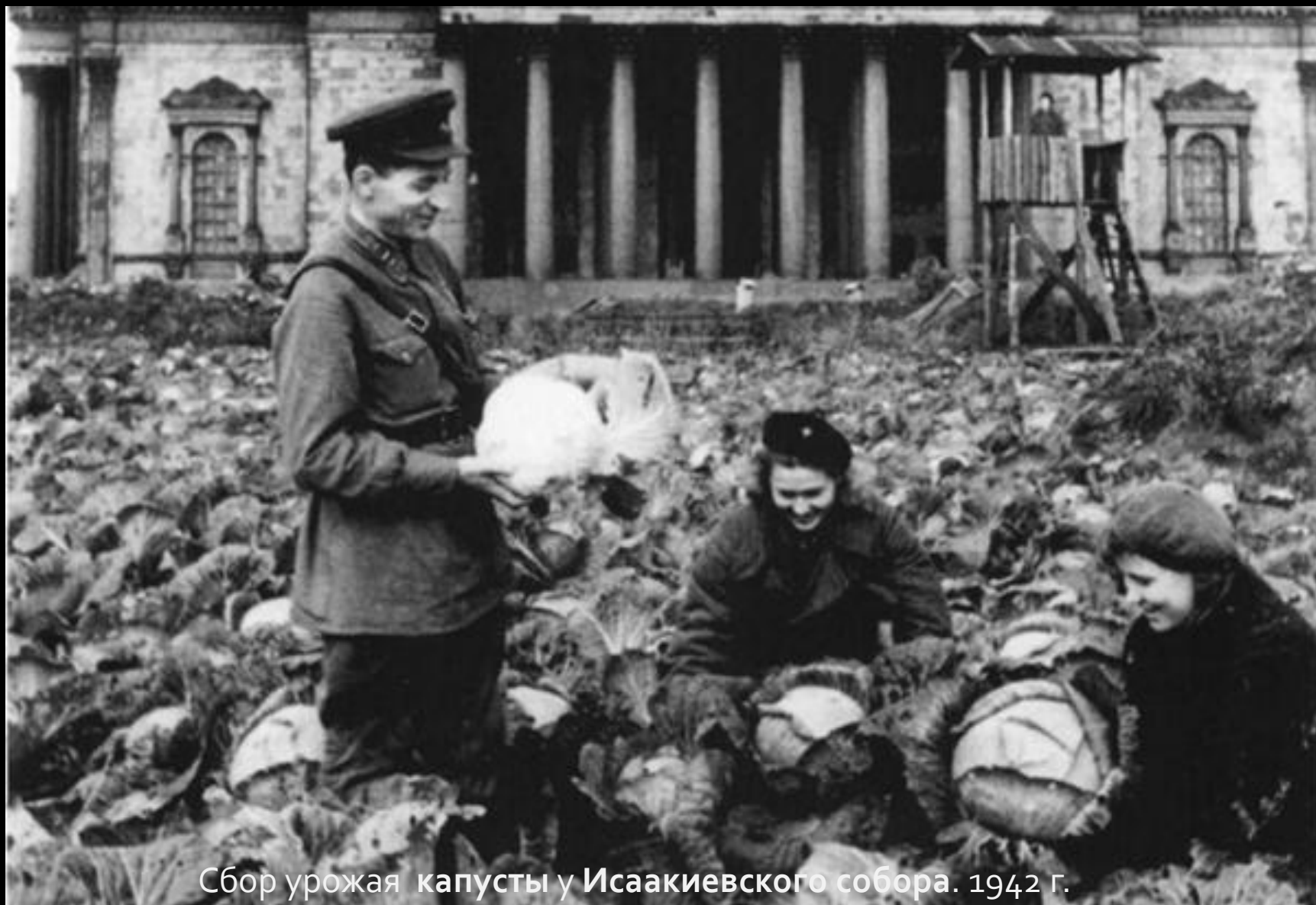
Сбор урожая капусты у Исаакиевского собора. 1942 г.