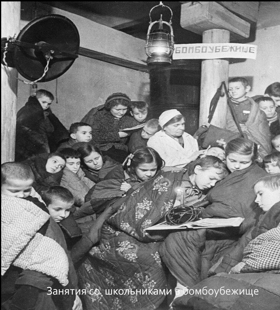
Занятия со школьниками в бомбоубежище