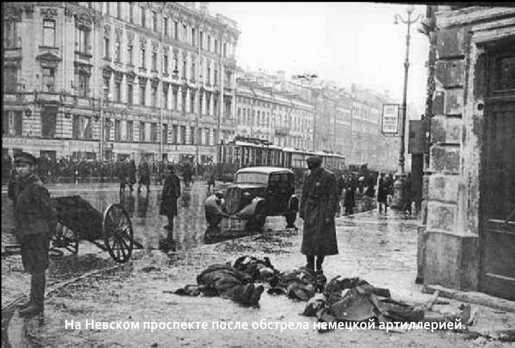
На Невском проспекте после обстрела немецкой артиллерией.