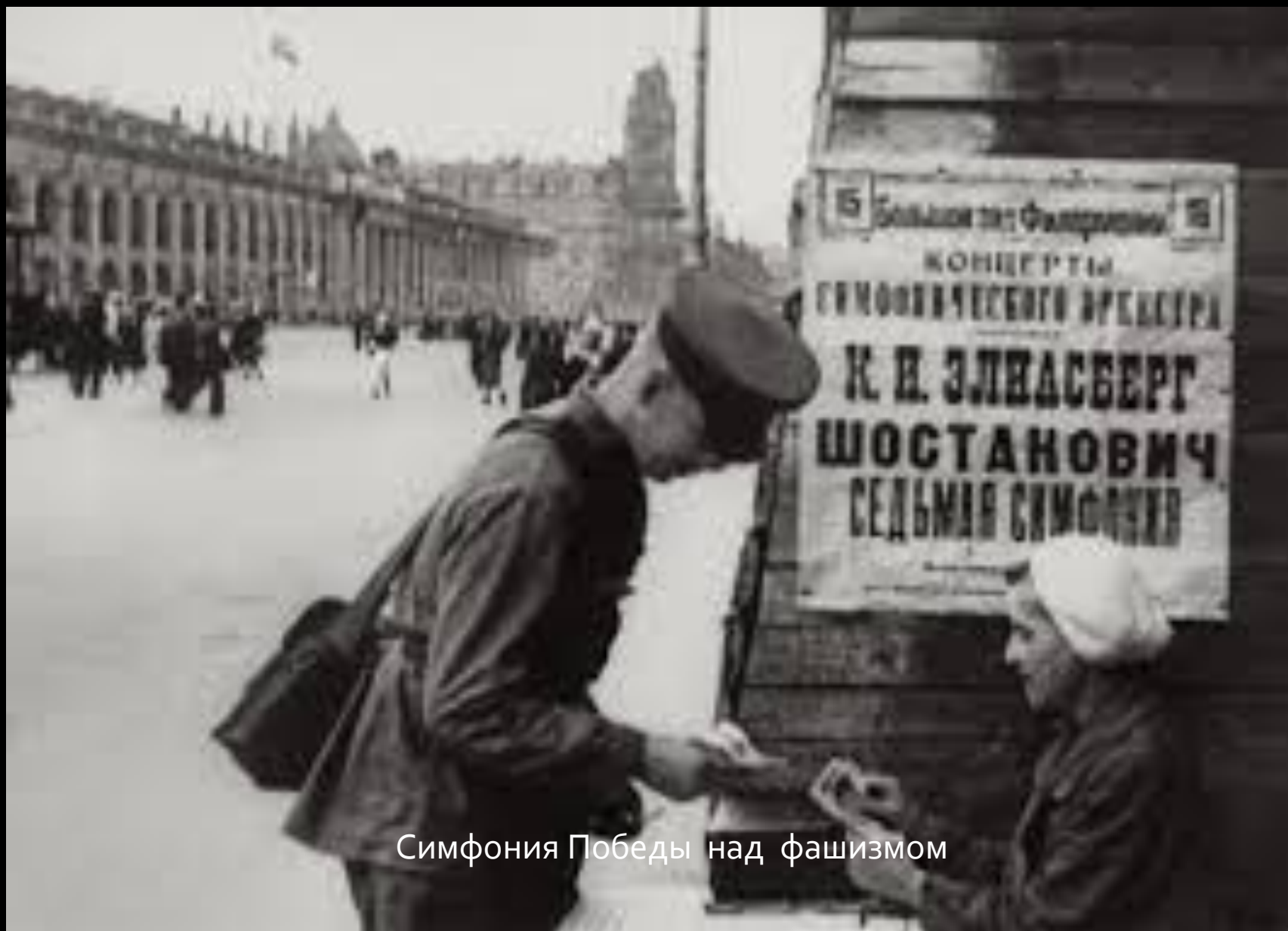
Симфония Победы над фашизмом