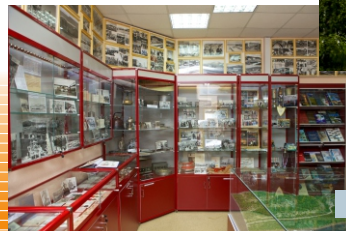
музей Колымской ГЭС