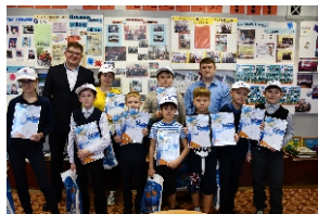
конкурс от РусГидро детского рисунка

Так же Специалисты постоянно проводят уроки по «Электробезопасности», «День воды», «Пожарная безопасность».