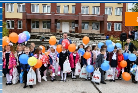
акция «Помоги собраться в школу»