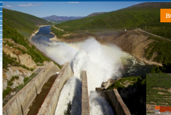
водоброс Колымской ГЭС