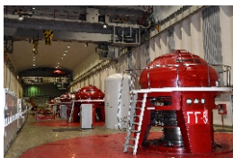
машинный зал КГЭС

Первая крупная гидроэлектростанция в области, Колымская ГЭС, уникальна по многим параметрам. Мощность ГЭС – 900 МВт, это первая столь мощная гидроэлектростанция в условиях вечной мерзлоты. Это самая мощная ГЭС в России с подземным расположением машинного зала, а грунтовая плотина Колымской ГЭС высотой 132 метра – самая высокая насыпная плотина в стране. Для сравнения, мощность Вилюйских ГЭС-1 и ГЭС-2 в совокупности 680 МВт, высота плотины 75 метров.