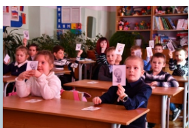
урок по «Электробезопасности»

Колымаэнерго каждый год проводит спартакиаду трудящихся по таким видам спорта как: футбол, волейбол, теннис, шахматы, плавание.