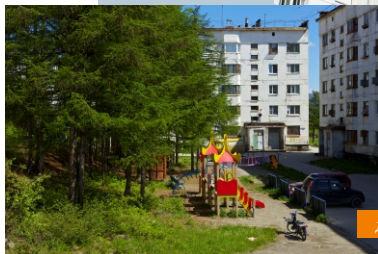
детская площадка в поселке