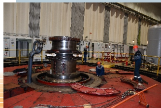
капитальный ремонт гидроагрегата