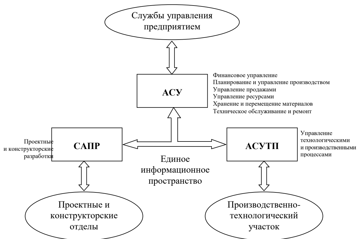
Рисунок 3.1 – Информационное пространство предприятия: АСУ – автоматизированная система управления; САПР – система автоматизированного проектирования; АСУ ТП – автоматизированная система управления технологическим процессом