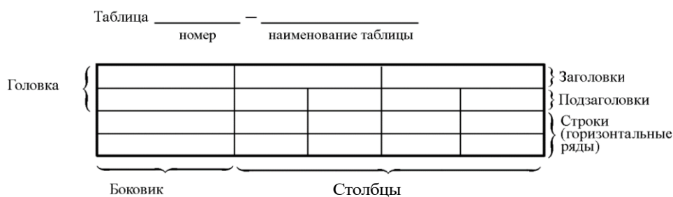
Рисунок 3.2 – Пример оформления таблицы

При переносе части таблицы на другую страницу слово «Таблица», ее номер и наименование указывают один раз слева над первой частью таблицы, а над другими частями, также слева, пишут слова «Продолжение таблицы» или «Окончание таблицы» и указывают номер таблицы. При этом допускается ее головку заменять номером столбцов.