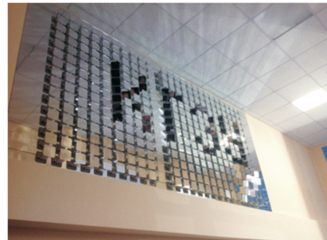
Рис. 2. Светотехнический автоматизированный зеркальный сегментный стенд «Зеркальная стена»

Широкомасштабное применение комбинации этих двух систем «умного» искусственного и гелио-освещения или каждой системы в отдельности позволит повысить энергоэффективность и снизить затраты на электроэнергию промышленных, бытовых и общественных зданий.