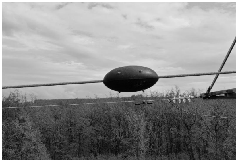
Рис. 1. Датчик анализа состояния ВЛЭП старая версия

пониженное значение массогабаритного показателя в отличии от предыдущей версии.