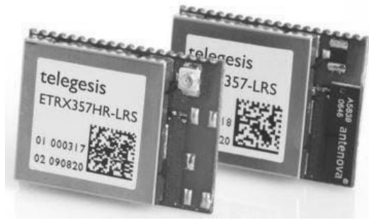
Рис. 2. Модуль связи ETRX357HR-LRS

Резюмируя, мониторинг гололеда для предотвращения аварийных ситуаций на ЛЭП является актуальной задачей для электросетевого комплекса. Существующие системы позволяют эффективно справляться с обозначенной проблемой. Частью данной системы является и описанное устройство, разработанное в связи с необходимостью обеспечения связи между элементами данной системы.