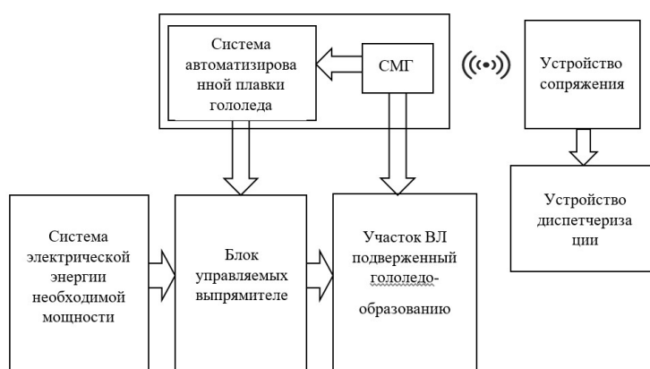
Рис. 1. Блок-схема работы системы автоматизированного контроля и устранения гололедообразования на воздушных линиях электропередачи

Для борьбы с ГИО существует мобильная система плавки гололеда, которая работает совместно с системой мониторинга гололедообразования (СМГ). В состав СМГ входит ряд датчиков, позволяющих сообщать об изменении температуры провода и окружающей среды, угле провиса провода и протекающем токе. Также в его состав входят модули радиосвязи для обеспечения беспроводного соединения с устройством обработки данных. Блок-схема системы автоматизированного контроля и устранения ГИО на ВЛЭП представлена на рис. 1.