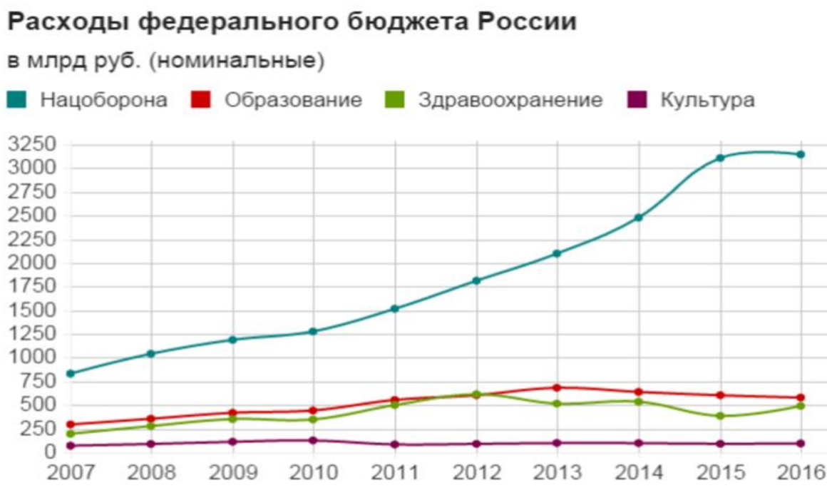
Рис.2 Расходы федерального бюджета России в млрд. руб.

Показателен следующий график, где на оси абсцисс находятся годы с 2007 по 2016, а по оси ординат – расходы федерального бюджета РФ в млрд. рублей. (рис.2)