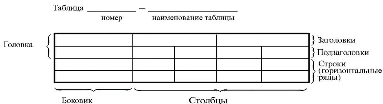
Рисунок 3.2 – Пример оформления таблицы

Пример оформления таблицы приведен на рисунке 3.2.