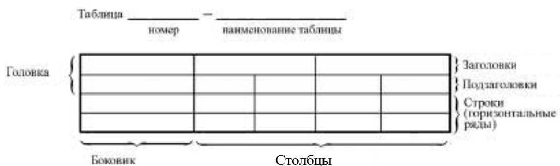
Рисунок 5.2 – Пример оформления таблицы

Пример оформления таблицы приведен на рисунке 5.2.