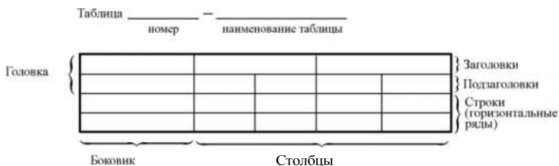
Рисунок 5.2 – Пример оформления таблицы

Пример оформления таблицы приведен на рисунке 5.2.