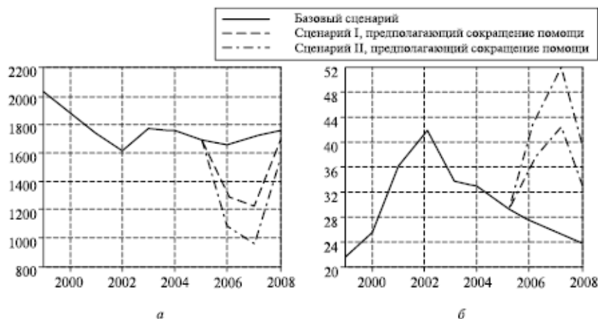
Рис. 1. Последствия сокращения помощи:

а – ВНРД на душу населения, долл. по курсу 1997 г.; б – уровень безработицы, %