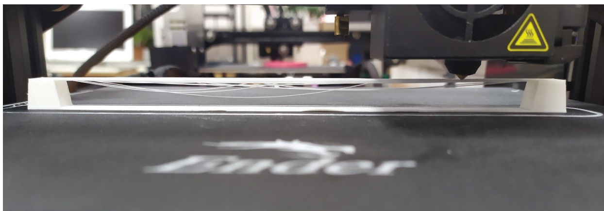
Рис. 2. Печать моста длиной 100 мм

сложным выступом из всех. Но и для подобных случаев существуют методы. Во-первых, если длина моста составляет не более 5 мм, то применение конструкции можно избежать и без применения каких-либо способов. Во-вторых, если длина моста всё же больше 5 мм, то его можно распечатать, снизив скорость движения экструдера (печатающей головки). При этом, чем медленнее будет двигаться экструдер, тем более плавно будут накладываться слои, соответственно и качество печати будет на порядок выше. Однако и на этот способ есть ограничение по длине – чем длиннее мост, тем меньше вероятность, что он распечатается удачно, это было доказано пробной печатью моста длиной 100 мм на принтере Creality Ender 3 Pro (рис. 2).