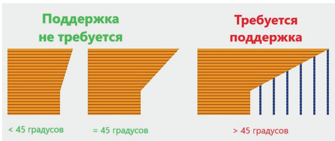
Рис. 1. Условия требования поддерживающей конструкции

Сложно устранить поддерживающие конструкции, если предстоит печатать элемент изделия, который провисает под углом больше чем 45 градусов. Обычно 3D принтер без проблем печатает нависающие элементы с меньшим наклоном. Если соблюдается правило в 45 градусов, то каждый последующий крайний слой накладывается поверх предыдущего со смещением не более чем 50 процентов, что уже достаточно основания для верхнего слоя, чтобы он не провалился под действием силы тяжести (рис. 1).