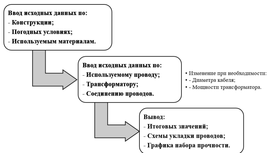
Рис. 2. Алгоритм автоматизированного расчета параметров греющего провода

На рис. 2 представлен общий алгоритм работы проектируемого приложения: